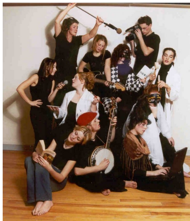
Des étudiants de Carleton-sur-Mer souhaitent développer un partenariat artistique avec un lycée de l'académie