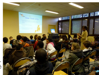
Des élèves du collège Clément Guyard de Créteil lors de l'intervention de Odette Toppin sur New York et la statue de la liberté

Ce programme permet à des établissements d'accueillir un membre de l'ambassade qui pourra traiter d'un sujet politique, culturel, économique et débattre avec les élèves en anglais ou en français. Une occasion rare de permettre aux élèves de discuter avec des représentants de la diplomatie américaine des enjeux du monde contemporain. 17 lycées ont bénéficié de ce programme en 2010-2011. Pour plus d'informations, vous pouvez vous rendre sur http://www.ac-creteil.fr/international-bilateraux-ameriquedunord.html